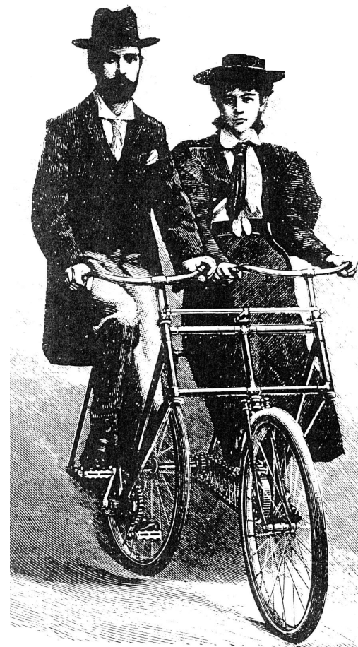
Tzv. „Manželské dvoukolo“. Zrovnoprávnilo slabší polovičku tím, že ji přesunulo z pořádného místa vzadu na bok.