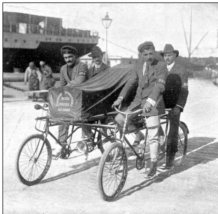
Jednoduchým spojením dvou dvojkol vznikl velice vzdušný pohřební vůz. Tento Cimrmanův vynález se uplatnil v Alexandrii.